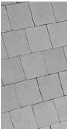
PRZYKŁAD UŁOŻENIA KOSTKI BRUK-BET "URBANIT" 16x16 - KOLOR SZARY ANTIC